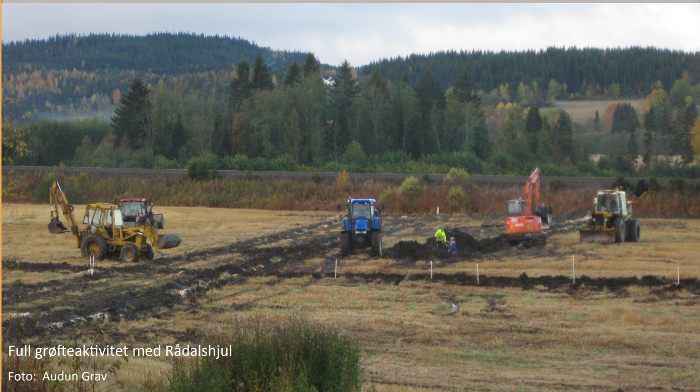
Full grøfteaktivitet med Rådalshjul

I påvente av at regelverket for tilskudd kommer, kan det være greit å se over jorda og finne ut hva som bør gjøres.