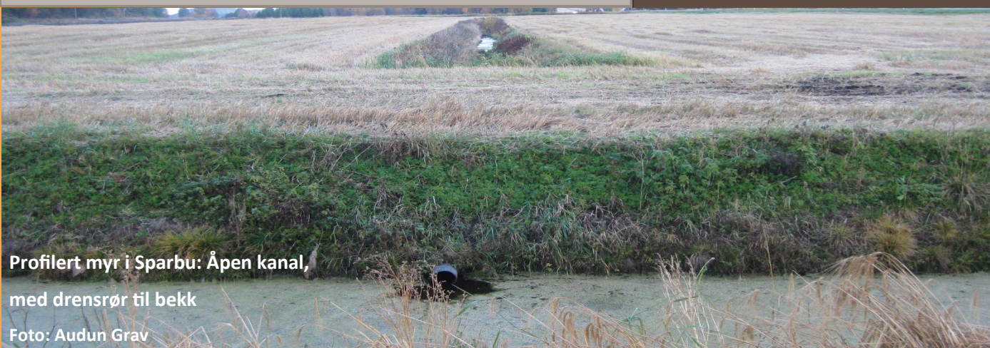
Profilert myr i Sparbu: Åpen kanal, med drensør til bekk

Gå sammen med andre bønder om andbud på rør, filter og maskin etc.